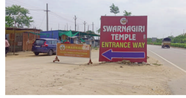
టైమ్స్ ఆఫ్ వార్త - యాదాద్రి

తెలంగాణ రాష్ట్ర ప్రభుత్వం ఏర్పాటు చేసిన మైసూర్ విద్యార్థులకు గురుకులాల వరంగా మారాయి. 5వ తరగతి నుండి 12వ తరగతి వరకు విద్యార్థులను విద్యార్థులకు కార్పొరేటర్ స్థాయిలో ఉచితంగా నాణ్యమైన విద్య అందించేందుకు రాష్ట్ర ప్రభుత్వం అహర్నిశలు కృషి చేస్తుంది. ఈ గురుకులాలలో విద్యను అభ్యసించే విద్యార్థులు చదువుకోపాటు పలు అంశాలలో రాజీనామా కార్పొరేటర్ స్థాయి విద్యార్థులకు సవాల్ విసిస్తున్నారు. రాష్ట్ర ప్రభుత్వం ఒక్కొక్క విద్యార్థిపై రూ. 1.50వేల ను ఖర్చుచేసి నాణ్యమైన విద్యను