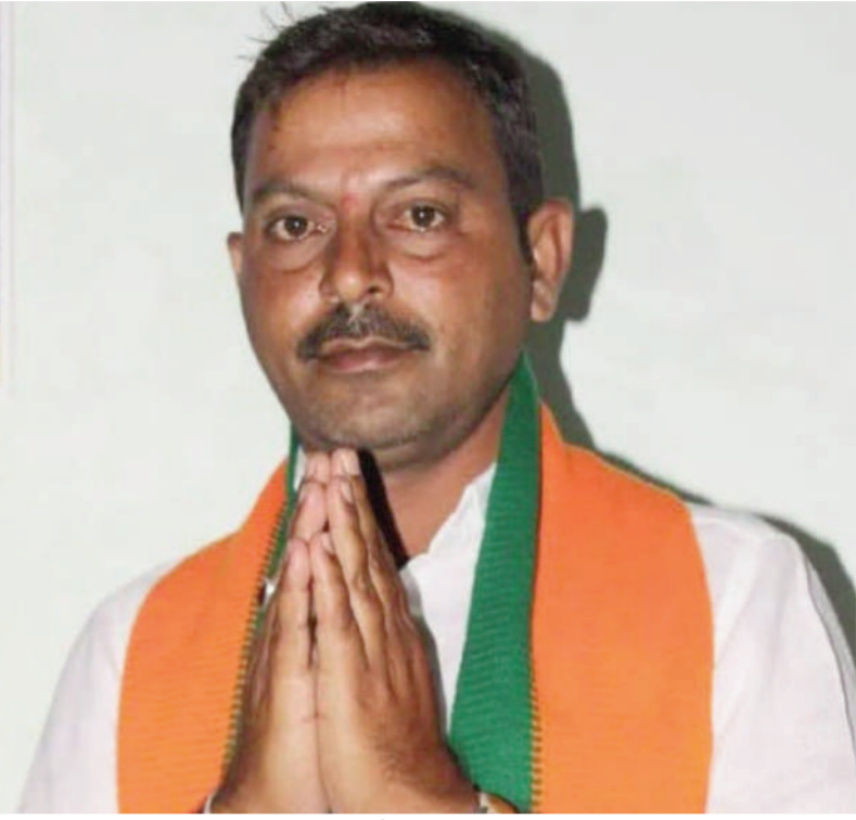
పెద్దలు పాఠశాల నడుపుకుంటూ అధిక ఫీజులు వసూలు చేస్తున్న వారిపై కూడా చర్యలు తీసుకోవాలని ప్రభుత్వాన్ని కోరారు. ప్రైవేటు విద్యా సంస్థలకు అనుకూలంగా పనిచేస్తున్న అధికారులపై వెంటనే చర్యలు తీసుకోవాలని ప్రభుత్వాన్ని డిమాండ్ చేశారు.