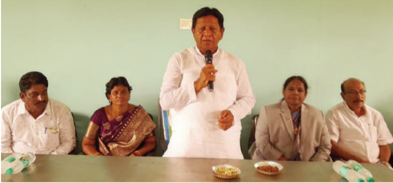
తైమ్స్ ఆఫ్ వార్త - ఎడపల్లి